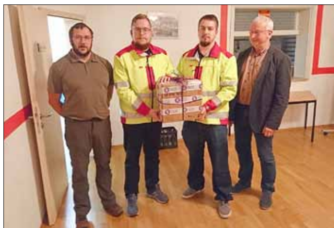
Übergabe des Defibrillators durch die Firma Mint of Finland GmbH

Weitere Informationen über uns finden Sie auch auf unserer Internetseite unter www.feuerwehr-halsbruecke.de .