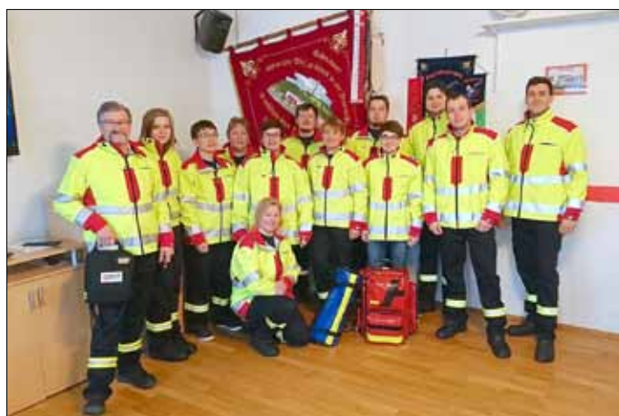
Ein Teil der First Responder der FFW Halsbrücke