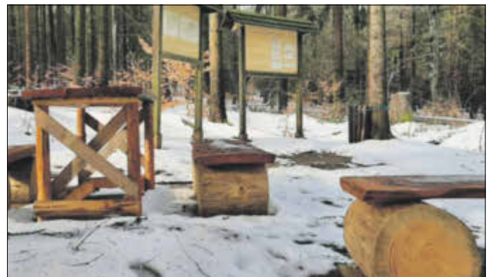
Sitzgruppe in Hetzdorf

der kalendarisch begonnene Frühling kündigt sich in der Natur unaufhaltsam an und weckt Hoffnung und Zuversicht, die wir alle so notwendig brauchen. Nutzen Sie die bevorstehenden Feiertage für einen Spaziergang in die Umgebung. Meine Empfehlung in diesem Jahr ist ein Besuch des Glasschmelzplatzes bei Hetzdorf im Tharandter Wald.