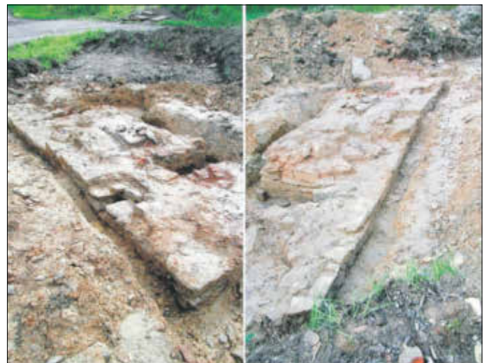
Fundamentreste eines Schmelzofens

Oberhalb der ehemaligen Rohpappenfabrik befand sich die „Vierte Maas Turmhofer Hütte“. Bis heute zeugt die große Schlackenhalde unterhalb des Halsbacher Gasthofs von dieser Hütte.