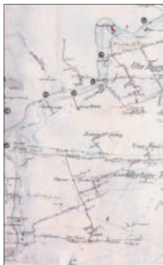
Ausschnitt aus einem Grubenriss mit Nachträgen;

Von den mit Sicherheit auf der Sandbank betriebenen Schmelzhütten gibt es weder schriftliche Zeugnisse noch Ausgrabungsfunde. Ein Grund für die fehlenden Ausgrabungsreste dürfte in den häufigen Überflutungen dieses Gebietes zu finden sein. Nur die heute noch reichlich vorhandenen Schlacken, die durchaus auch von weiter oben im Tal gelegenen Schmelzhütten stammen