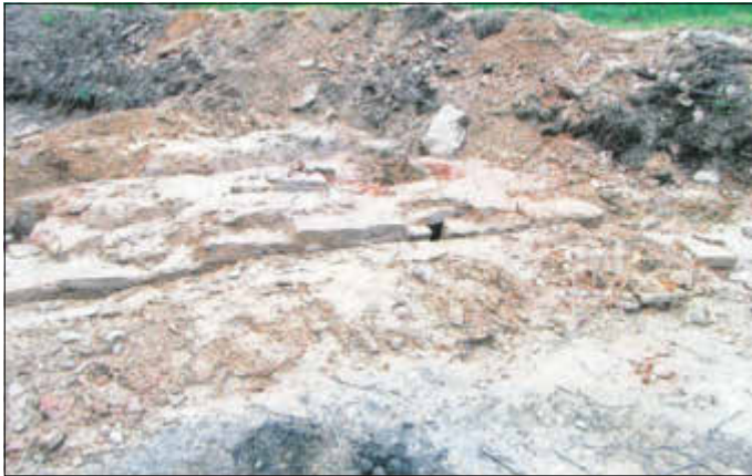
Fundamentreste eines Schmelzofens

Zum Schmelzen waren große Mengen Holzkohle erforderlich. Im Wald oberhalb der Fuchsmühle sind einige Hohlwege sichtbar, die durch den Holzkohletransport vom Tharandter Wald über die Naundorfer Kohlenstraße ins Muldental entstanden sind.