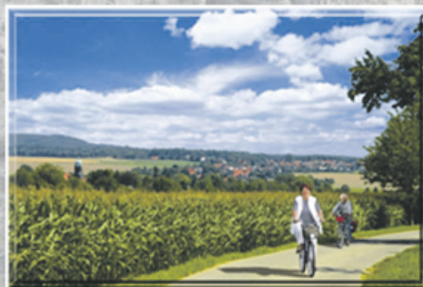
Blick auf Lohmen