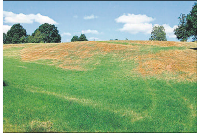
Halden am „Todenberg“, die durch die Trockenheit im Sommer 2018 sichtbar wurden

Zum Schmelzen waren große Mengen Holzkohle erforderlich. Im Wald oberhalb der Fuchsmühle sind einige Hohlwege sichtbar, die durch den Holzkohletransport vom Tharandter Wald über die Naundorfer Kohlenstraße ins Muldental entstanden sind.