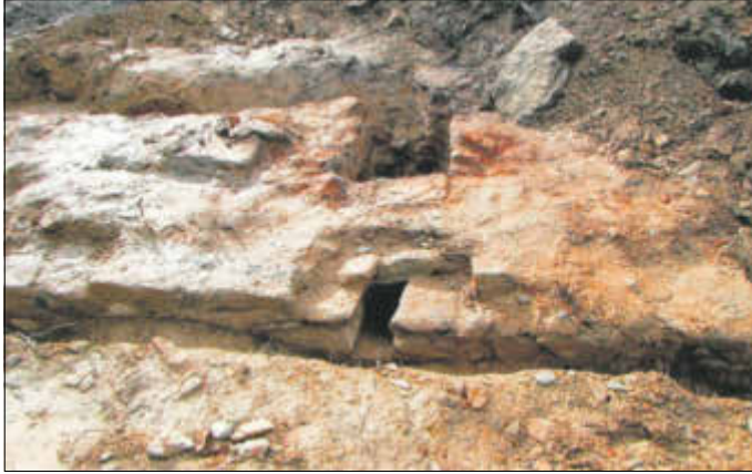
Fundamentreste eines Schmelzofens